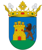
CASTILBLANCO DE LOS A.